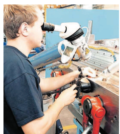
Gute Aussichten: In Züttlingen geht es wieder aufwärts.

Zudem, so betonen die beiden Geschäftsführer, stehe der Kunde viel mehr im Mittelpunkt als zuvor. Zuverlässigkeit und Termintreue hat sich der neue Formenbau auf die Fahnen geschrieben. „Dadurch haben wir so manche Kunden gewinnen können, die Lämple verloren hatte“, sagt Bieber.