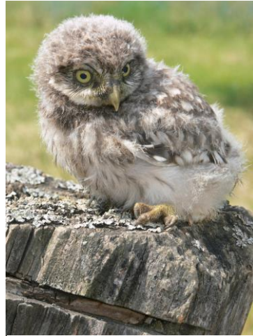
Ein junger Steinkauz in einem kleinen Streuobstbestand

Regionale Sorten spiegeln die lange Kulturgeschichte der Streuobstwiesen wider. Bei Neuanlagen sollte die Sortenwahl daher möglichst regional erfolgen. Die Auswahl hat jedoch naturschutzfachlich keine Bedeutung, denn die Obstbäume besuchenden Wildbienen sind nicht auf diese Sorten spezialisiert (sogenannte polyektische Arten). Auch für die Vogelarten sind Bäume ohne Unterscheidung von Sorten eine wichtige Habitatstruktur. Viele Vogelarten benötigen zudem nur Baumgruppen und nicht dichte Baumbestände, wie beispielsweise der Steinkauz ( Athene noctua ) oder der Wendehals, damit genügend offene Fläche als Jagd- und Nahrungshabitat übrigbleiben.