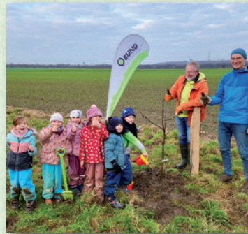
Spaß beim Naturschutz!