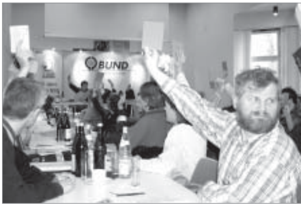
Grüne oder rote Karte? Die BUND-Delegierten diskutieren auf dem Bonner Venusberg den künftigen BUND-Kurs.