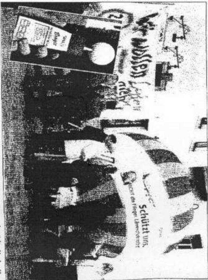
Der Lärm nervt die Bewohner der Ernst-Thälmann-Straße in Bad Lauchstädt. Sie hoffen auf ständige Kontrolle der Tempo 30-Zone durch die Polizei oder ein generelles Verbot zum Befahren der Straße für Schwerlasttransporte.

gestellte BAB 38 ist auch trügerisch. Vor allem vor dem Hintergrund, dass viele Fuhrunternehmern wegen der Autobahn-Maut auf Landstraßen ausweichen.